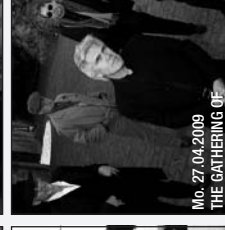
Mo. 27.04.2009 THE GATHERING OF