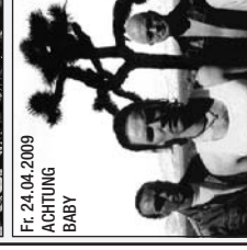
Fr. 24.04.2009 ACHTUNG BABY