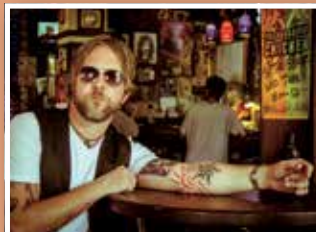
DEVON ALLMAN & BAND Mo. 26. September 20:00 Uhr