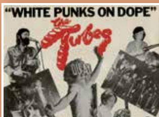
THE TUBES Di. 27. September 20:00 Uhr