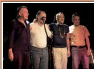
GURU GURU Do. 3. November 20:00 Uhr