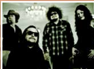
TITO & TARANTULA So. 25. September 19:00 Uhr